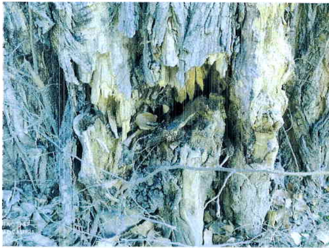
сл. 3 Појава трулежи у приданку стабла јаблана (фото 24. 02. 2021.)