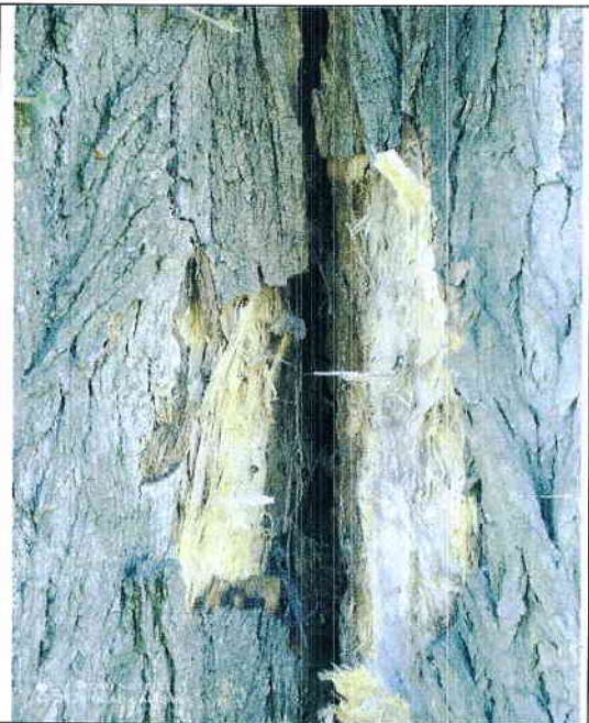
сл. 4 Изглед доњег дела стабла јаблана према Декеровој бараци (фото 24. 02. 2021.)