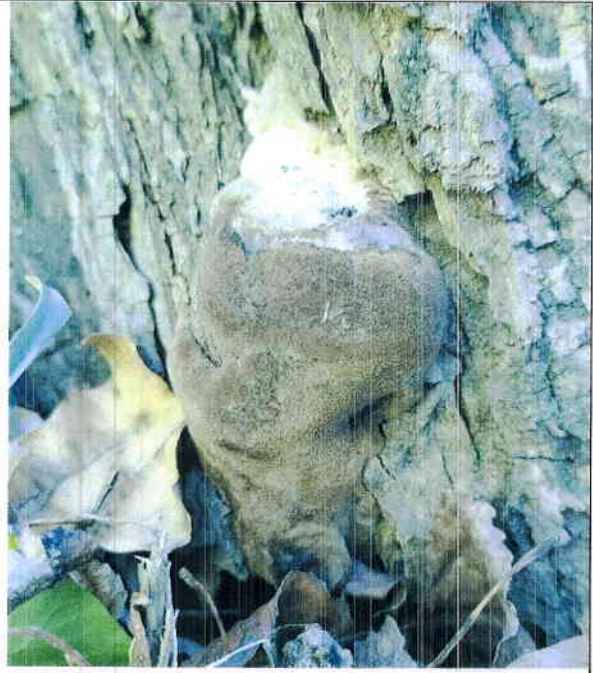
сл. 2 Плодоносна тела гљива у приданку стабла јаблана према Декеровој бараци (фото 24. 02. 2021.)