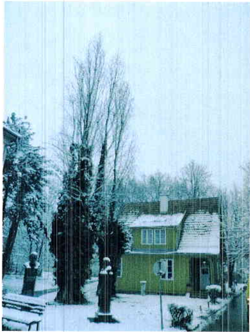
сл. 1 Стабла јаблана код Пастеровог завода (фото 12. 01. 2021.)